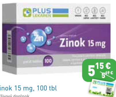
Zinok 15 mg, 100 tbl Výživový doplnok.