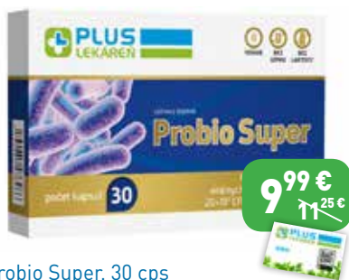
Probio Super, 30 cps Výživový doplnok.