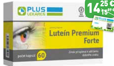
Luteín Premium Forte, 60 cps Výživový doplnok.