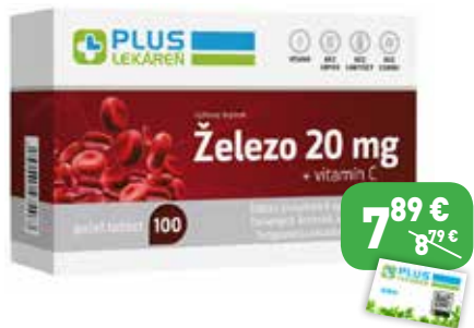
Železo 20 mg + vitamín C 100 mg, 100 tbl Výživový doplnok.