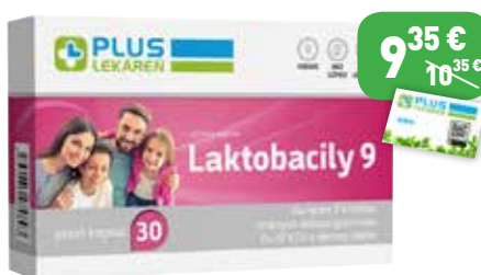
Laktobacily 9, 30 cps Výživový doplnok.