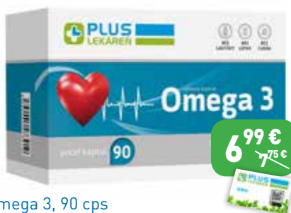
Omega 3, 90 cps Výživový doplnok.